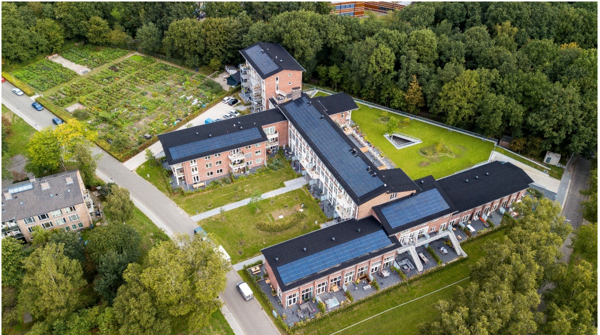
Zonnestroomsysteem Wooncollege, Bonairelaan 10 t/m 88

Informatie Memorandum verbonden aan de uitgifte van een senior 4,5% Obligatielening van maximaal €400.000 verbonden aan de financiering van de exploitatie van een Portefeuille Duurzame Energiesystemen door Kombo Energy V.O.F.